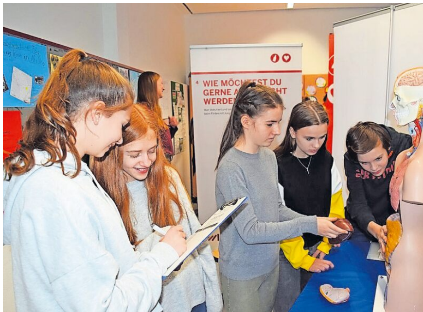
Ausbildungsbotschafter stellen an Schulen ihren Beruf und Betrieb vor – und bieten Schülern somit Orientierungshilfe für ihre berufliche Zukunft.

„Ausbildungsbotschafter“ mit neuem Netzwerk